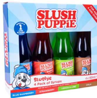
Front of Pack

Item 300178 - SLUSH PUPPIE 4pk Syrup Set-BluRasp,Strwb,Cola,L&L Batch/Lot Number : 20672 Expiry Date: 11/2026