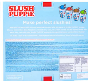
Back of Pack